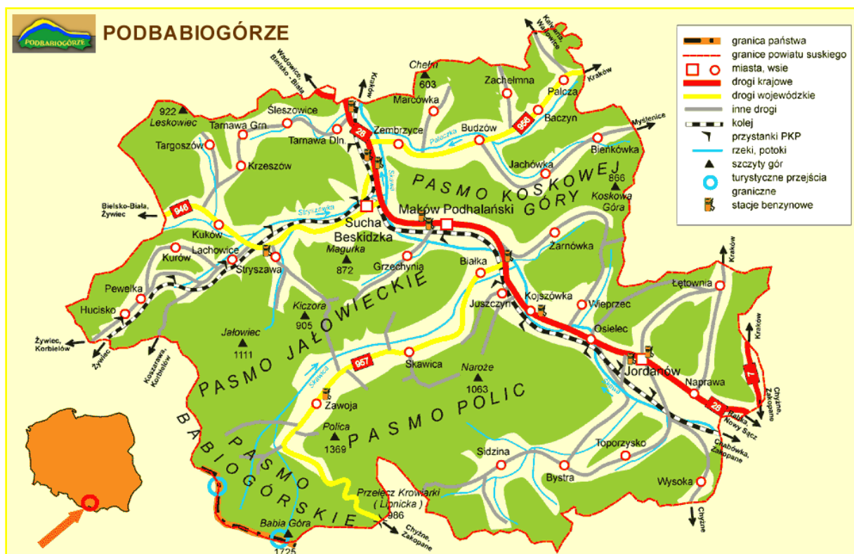
Mapa obszaru Stowarzyszenia Lokalna Grupa Działania „Podbabiogórze”

Inne bardzo cenne przyrodniczo tereny znajdujące się w granicach obszaru to „Rezerwat na Policy im. prof. Zenona Klemensiewicza” - utworzony w 1972 r. o powierzchni 58,70 ha, na północ od szczytu, na terenie gminy Zawoja oraz rezerwat przyrody „Na Policy” utworzony w 1998 r., o powierzchni 13,21 ha, na południe od szczytu, na terenie gminy Bystra-Sidzina. Rezerваты te chronią naturalny górnoreglowy bór świerkowy wraz z ostoją chronionych gatunków zwierząt, wśród których występuje m.in. głuszec, dla którego populacji pasmo Policy jest ostoją. Głównie z tego powodu teren pasma również został włączony do europejskiej sieci „Natura 2000” jako obszar specjalnej ochrony ptaków i znajduje się także na liście obszarów mających znaczenie dla Wspólnoty Europejskiej ze względu na cenne siedliska przyrodnicze. Szczytowe partie pasma Leskowca i Łamanej Skały wraz z ich południowymi i południowo-wschodnimi stokami, położone w północno-zachodniej części obszaru, wchodzi w skład Parku Krajobrazowego Beskidu Małego, utworzonego w 1998 r. celem ochrony walorów przyrodniczych, krajobrazowych i kulturowych tej grupy górskiej. Południowo wschodnie tereny powiatu suskiego to część rozległego Południowomałopolskiego Obszaru Chronionego Krajobrazu. Łącznie na terenie sześciu gmin znajdują się obszaru chronionego krajobrazu co stanowi 66,67% całego obszaru.